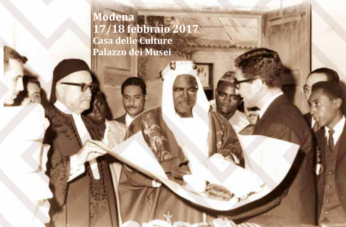
A cura dell'ufficio grafica del Comune di Modena: Cinzia Casarita

Modena 17/18 febbraio 2017 Casa delle Culture Palazzo dei Musei